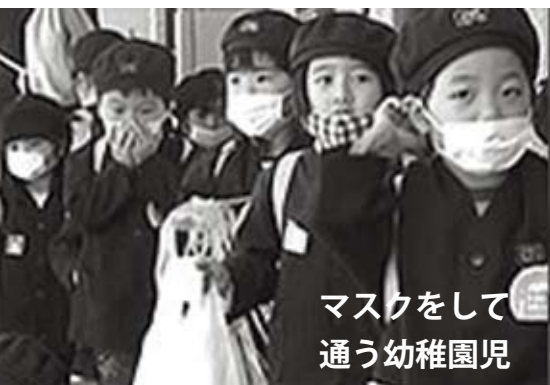
マスクをして 通う幼稚園児