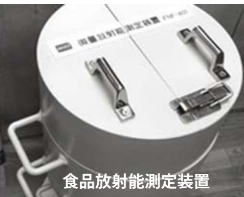
食品放射能測定装置