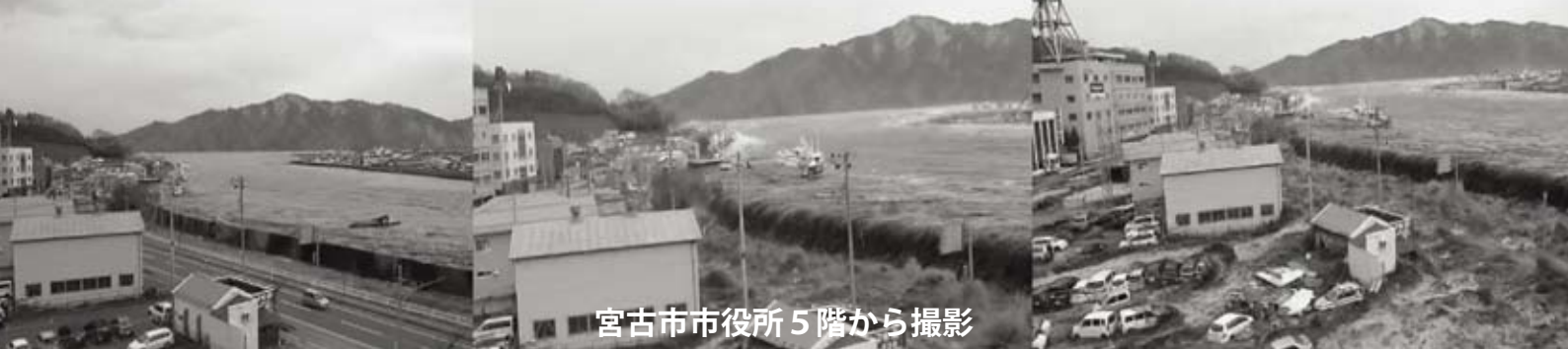
宮古市市役所5階から撮影